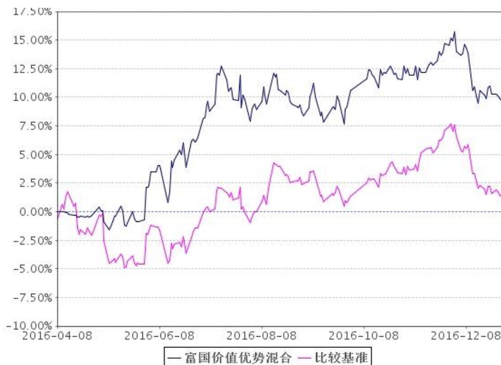
基准收益率变动的比较